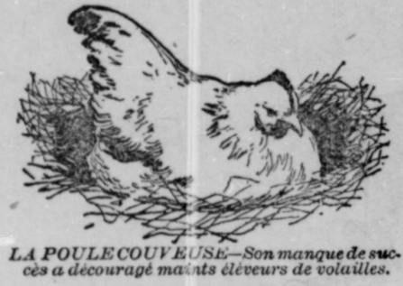
LA POULE COUVEUSE—Son manque de succès a découragé maints éleveurs de volailles.

L'Appareil Incubateur Chatham et Couveuse a créé une nouvelle ère dans l'élevage des Volailles.