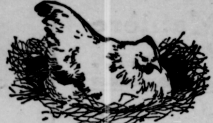
LA POULE COUVEUSE—Son manque de succès a découragé maintes élèveuses de volailles.

Vous pouvez faire de l'argent en élevant des poulets suivant la vraie méthode—en ferez abondamment.