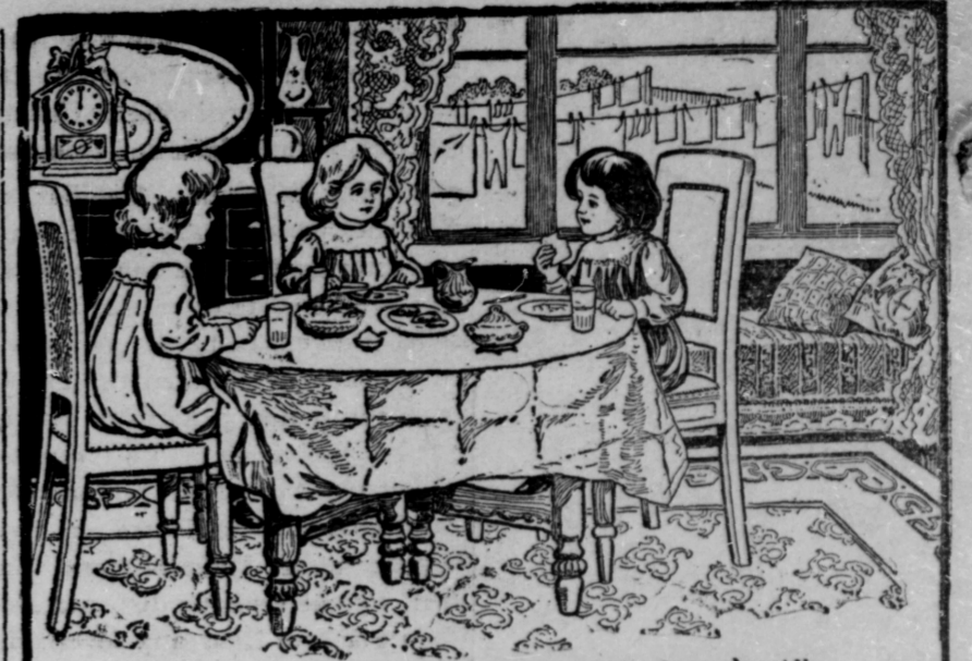
Les jeunes filles Sunlight ont toujours fini leur lavage à midi.

Ce qui contribuait essentiellement à leur bonheur, c'était leur activité et leur amour pour le travail. L'instituteur remplissait avec un grand zèle et une scrupuleuse exactitude les devoirs de sa charge, et les progrès de ses élèves étaient pour lui une source pure de jouissances véritables. Les moments qui restaient à sa disposition,