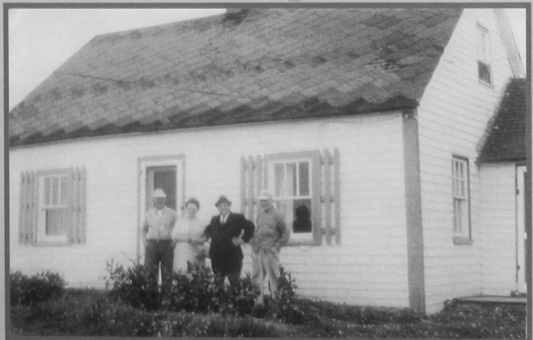
Maison Doucet : description page 8

SPEC-PEI FC 2601 .P48 no.16-20 2002-2006