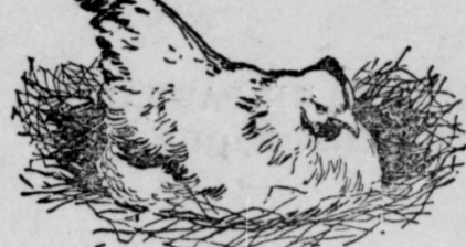
LA POULE COUVEUSE—Son manque de succès à élever maints éleveurs de volailles.

Vous pouvez faire de l'argent en élevant des poulets suivant la vraie méthode—en ferez abondamment.