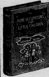
16mo, 144 pages; bound in linen, gilt top.