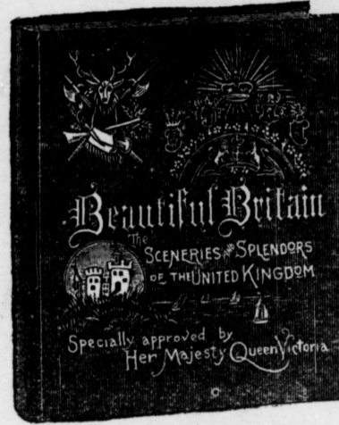
Large quarto volume (11 1/2 x 13 1/2 ins.), 385 pages. Extra enameled paper. Extra English cloth, emblematic embossing in ink and gold.

The Scenery and the Splendors of the United Kingdom.