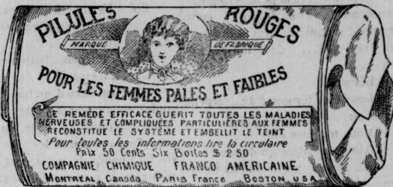
Fac-Simile exact d'une boîte de Pilules Rouges.

Nos Pilules Rouges sont une spécialité pour les maladies des femmes seulement ; c'est ce qui fait leur force et leur popularité. Il est impossible à un remède de guérir tous les maux. Jamais, dans l'histoire de la médecine, un remède n'a obtenu autant de guérisons que nos Pilules Rouges. Nous demandons à nos nombreuses clientes de ne pas comparer nos Pilules Rouges aux autres remèdes guérissant tous les maux, entre autres, aux remèdes liquides qui ne doivent leur effet stimulant qu'à l'alcool qu'ils renferment.