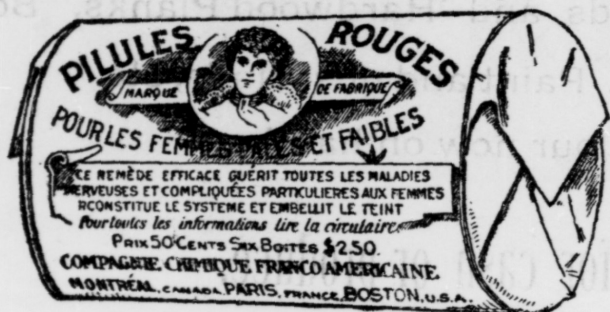
L'Étiquette est de papier blanc imprimé en rouge.

plaisirs. Mais l'amour de la patrie, quelque fort qu'il soit, cède à l'amour de la religion, à l'amour de Dieu. Comme ils ont servi la patrie sans compter avec le danger, de même ces généreux confesseurs entendent souffrir l'exil, donner leur vie même, si il le faut, pour attester leur foi. Voilà les souvenirs que cette fête évoque dans notre mémoire. Voilà les souvenirs qui font tréssaillir, palpiter, nos cœurs d'une triste mais fière émotion, car ces souvenirs, ce sont les nôtres, ils nous appartiennent, à nous Acadiens et à nous seuls, si nous aimons le Canada autant que nos concitoyens d'autre race, nous aimons notre chère Acadie d'un amour encore plus tendre et à la fois plus fort.