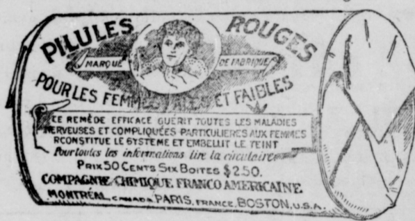
L'Etiquette est de papier blanc imprimé en rouge.