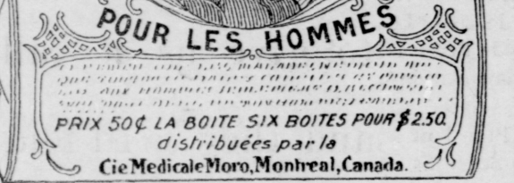
Fac-similé d'une boîte de Pilules Moro.

Monsieur Calixte Renaud, de cette ville, écrit: "Après avoir souffert pendant deux ans de la