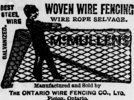
Manufactured and Sold by THE ONTARIO WIRE FENCING CO., LTD. Picton, Ontario.