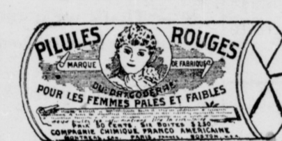
Le papier est blanc imprimé en encre rouge.

Les Pilules Rouges pour les Femmes Pâles et Faibles ne se vendent jamais à la douzaine, au cent ou à 25c la boîte, mais toujours en boîte de 50 Pilules Rouges chaque, jamais autrement. Sur réception du montant, 50c pour une boîte ou $2.50 pour six boîtes, nous les enverrons par le retour de la malle. Comme garantie, exigez sur chaque boîte le nom de la