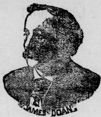
The Originator of