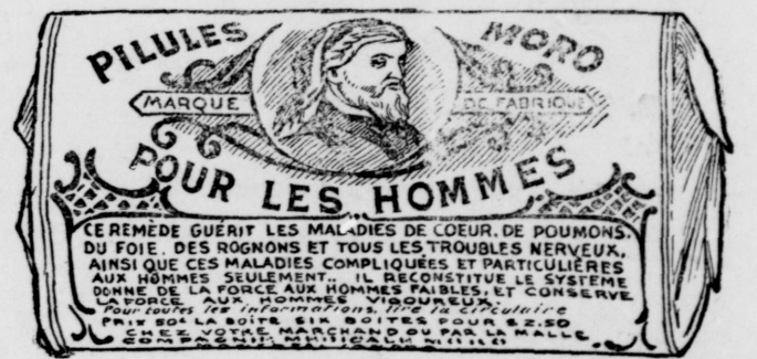
Le papier de l'enveloppe est blanc, imprimé en bleu.

COMPAGNIE MEDICALE MORO, 1724 rue Ste-Catherine, Montréal.