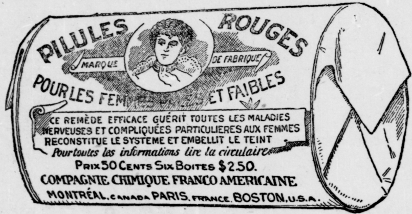
Le papier de l'enveloppe est blanc, imprimé en rouge.

COMPAGNIE CHIMIQUE FRANCO-AMERICAINE, 274 St-Denis, Montréal.