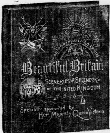
Large quarto volume (11 1/2 x 13 1/2 ins.), 385 pages. Extra enameled paper. Extra English cloth, emblematic embossing in ink and gold.

A magnificent collection of views, with elaborate descriptions and many interesting historical notes. Text set within emblematic borders, printed in a tint. A fine example of up-to-date printing.