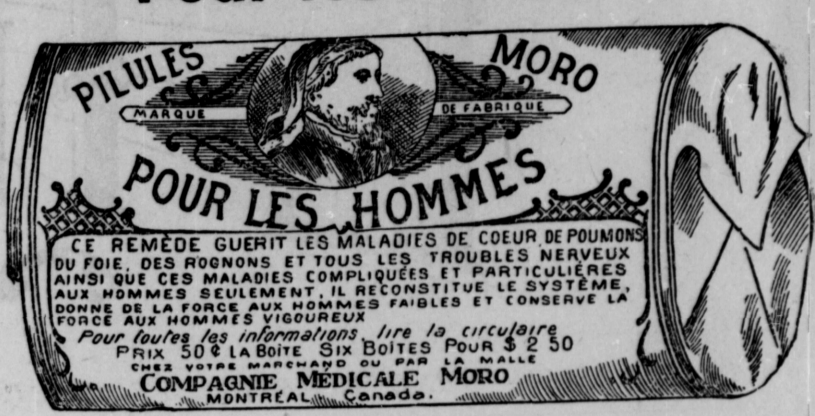
Fac-Smile exact d'une boîte de Pilules Moro.

Donnez-nous un homme brisé par les excès, la dissipation, un travail trop dur, les tracas, ou par toute autre cause qui ait sapé sa vitalité, avec les Pilules Moro nous le rendrons aussi vigoureux en tous points, que n'importe quel homme de son âge.