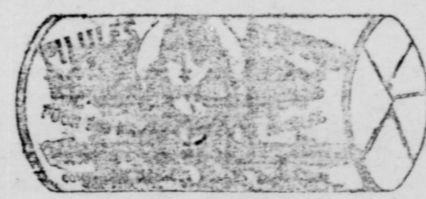
Le papier est blanc imprimé en encre rouge.

Nous invitons aussi nos patientes à venir voir les Médecins Spécialistes de la CIE CHIMIQUE FRANCO-AMERICAINNE, si elles désirent avoir plus de renseignements sur leurs maladies ou sur le mode d'emploi des PILULES ROUGES, ou de leur écrire; les consultations, personnelles ou par lettres données par nos Médecins sont absolument gratuites et ne pourront manquer d'être utiles aux femmes qui souffrent et veulent se guérir. Nos PILULES ROUGES se vendent par la boîte ou 6 boîtes pour $2.50, envoyées par la poste au Canada et aux États-Unis sur réception du montant.