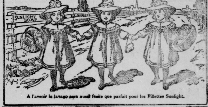
A l'avenir le lavage sera aussi facile que parfait pour les Fillettes Sunlight.