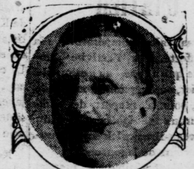
KING OF ITALY