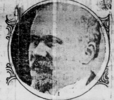
PRESIDENT OF FRANCE