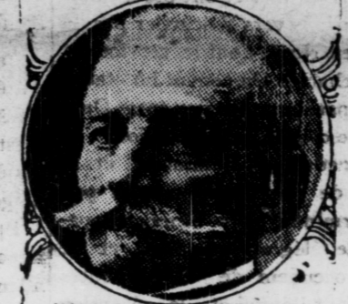
KING OF SERBIA