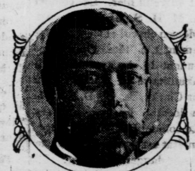
KING OF ENGLAND