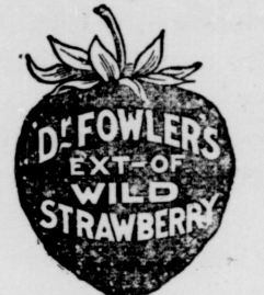
(Put up in yellow wrapper.)