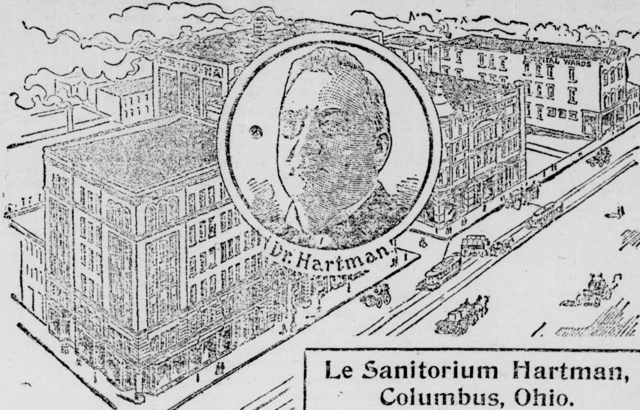
Le Sanitorium Hartman, Columbus, Ohio.