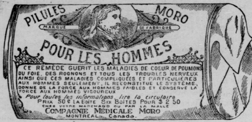
L'ac-Smile exact d'une boîte de Pilules Moro.

Donnez-nous un homme brisé par les excès, la dissipation, un travail trop dur, les tracas, ou par toute autre cause qui ait sapé sa vitalité, avec les Pilules Moro nous le rendrons aussi vigoureux en tous points, que n'importe quel homme de son âge.