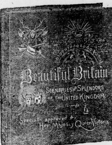
Large quarto volume (13 1/2 x 13 1/2 ins.), 36 pages. Extra enameled paper. Extra English cloth, emblematic embossing in ink and gold.

The Scenery and the Splendors of the United Kingdom.