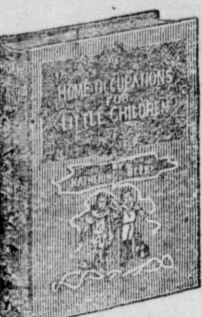
Home, 144 pages; bound in linen, gilt top.

Hundreds of Hints on How to Make the Little Folks Happy Lists of Stories, Songs and Plays Invaluable to Mothers and Nurses