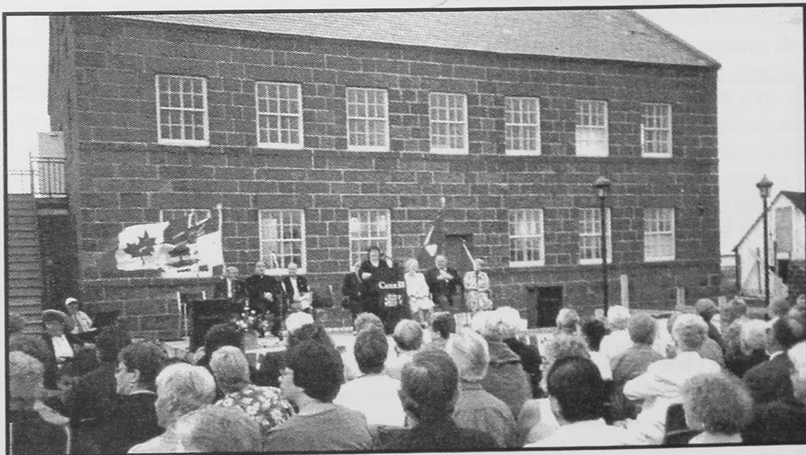
L'ouverture officielle de l'édifice restauré, le 29 juin 2000