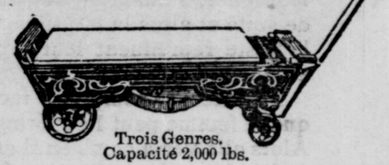
Trois Genres. Capacité 2,000 lbs.