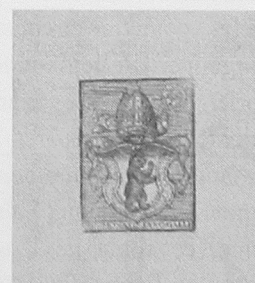
Ex-libris de l'abbaye Saint-Gall

Bibliothèque de l'ancienne abbaye bénédictine de Saint-Gall (Suisse) qui abrite l'une des collections les plus complètes de livres et manuscrits du haut Moyen Âge