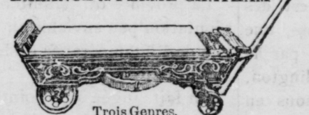
Trois Genres. Capacité 2,000 lbs.

Vous avez besoin d'une balance sur votre ferme. Ensuite vous vendez 1000 boisseaux de grain à 75 cents. Les balances du marchand ne sont fausses que de 1/40, mais votre perte est $18.75. La perte sur quelques transactions de ce genre s'accumulerait à un douzain de balances.