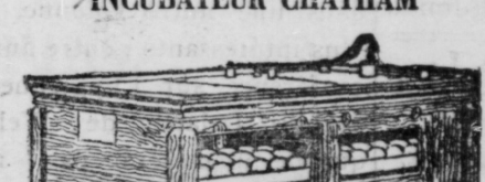
No. 1—60 Oeufs No. 2—120 Oeufs No. 3—240 Oeufs

L'élevage de volailles paie. Ceux qui vous disent qu'il n'y a pas d'argent dans l'élevage de poulets ont dû essayer de faire de l'argent dans ce négoce en employant des poules comme convulseuses, et ils auraient tout aussi bien pu essayer de découvrir une mine d'or dans le jardin aux choux. La mission de convulseuse, elle n'est pas dans son rôle. C'est la tâche de l'Incubateur Chatham et Convulseuse et il s'acquitte de sa mission avec un succès parfait.