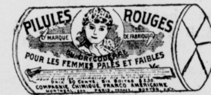
Le papier est blanc imprimé en encre rouge.