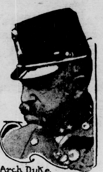
Arch Duke Frederick Commandant de l'Armée de l'Autriche.

Rome, 20.—Un message reçu de Trent, dit que l'Autriche, qui avait jusqu'ici mobilisé ses troupes avec une certaine prudence, mobilise aujourd'hui ouvertement du côté de la frontière italienne.